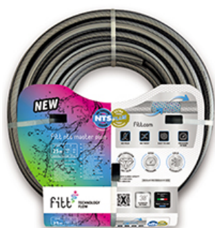
fitt nts master plus