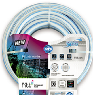
fitt nts marine