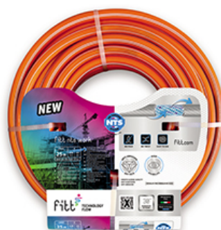
fitt nts work

La gama de mangueras profesionales se caracteriza por su resistencia a altas presiones y a los rayos UV. Además, está dotada de protección antialgas y garantía de 30 años. Dentro de esta línea, FITT propone tres modelos, cada uno para un uso específico: